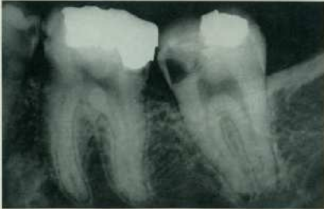
Abb. 52: Spongioma-Zeichnung gut erkennbar