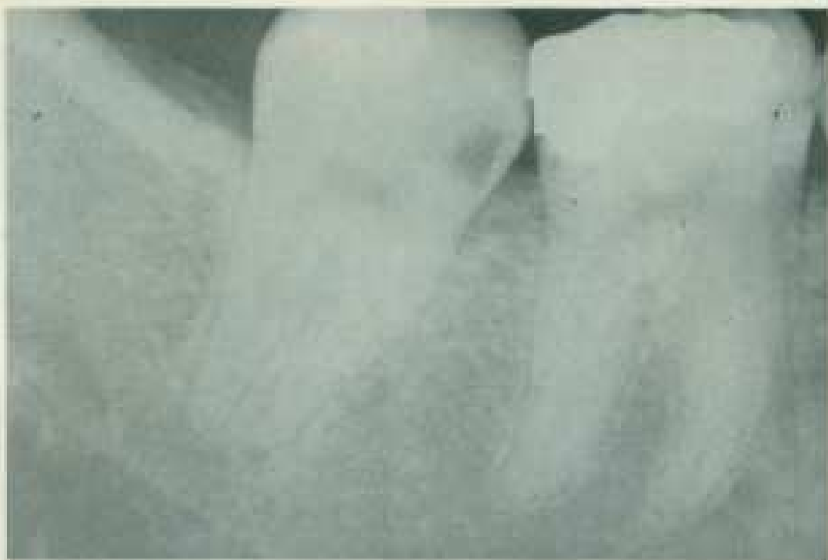
Abb. 51 Aufnahme zu hell