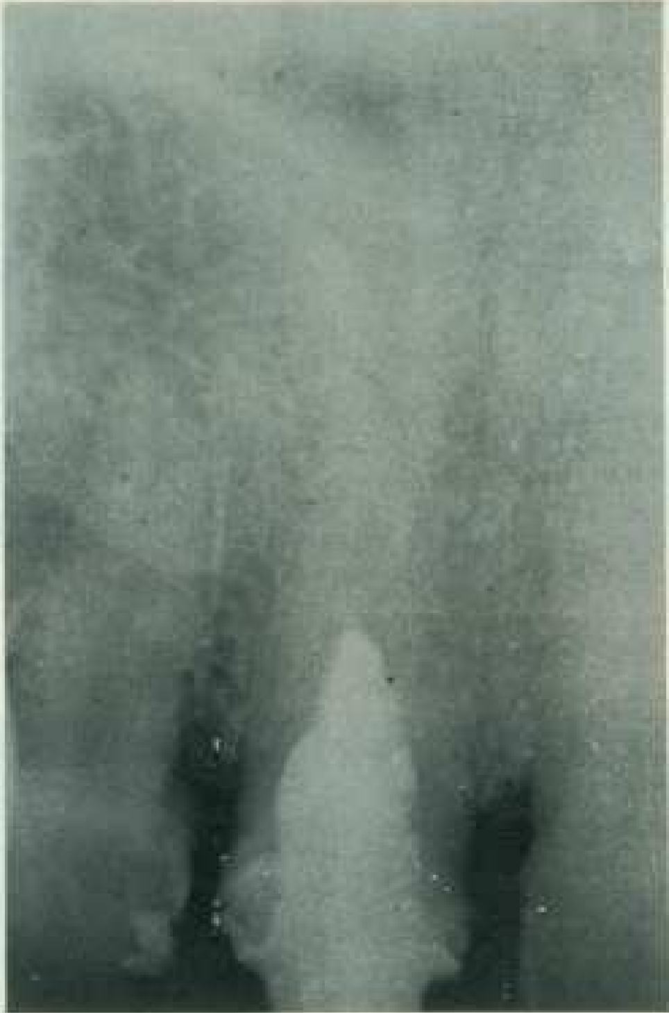
Abb. 56: Unschärfe Aufnahme. Außerdem Fehler beim Entwickeln: nicht auslösere