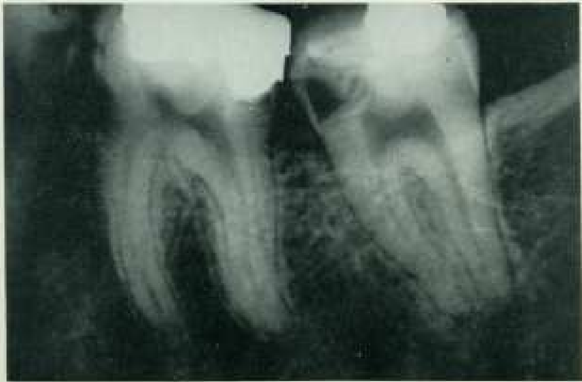
Abb. 50 Aufnahme zu dunkel