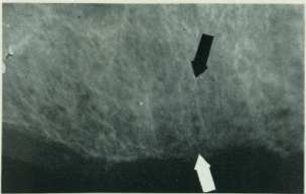
Abb. 65: Restostitis. Fremdkörper. Keine geschlossene Corticalis